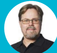
Bert-Ola Andersson Produktion