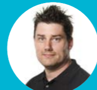
Mikael Hagberg Produktion