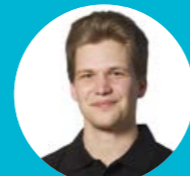
Johan Aldenbrandt Konstruktion